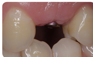
Hvordan kan vi her opnå et forudsigteligt resultat?