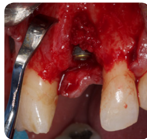
Implantat indsættelse og valg af knoglegenopbygning