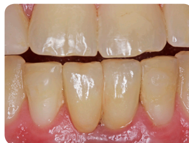
Hvor mange implantater er indsat?