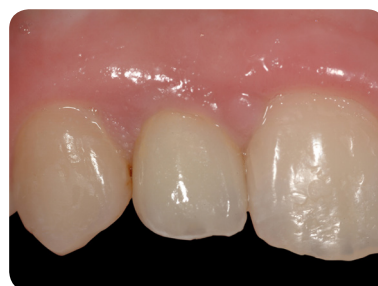
Hvad er suboptimalt med den implantatunderstøttede krone?